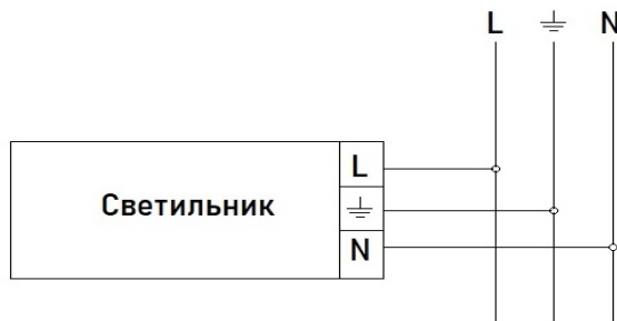
Рис. 2. Схема подключения к сети