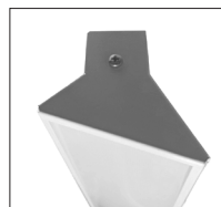
Master LED-02 с рассеивателем